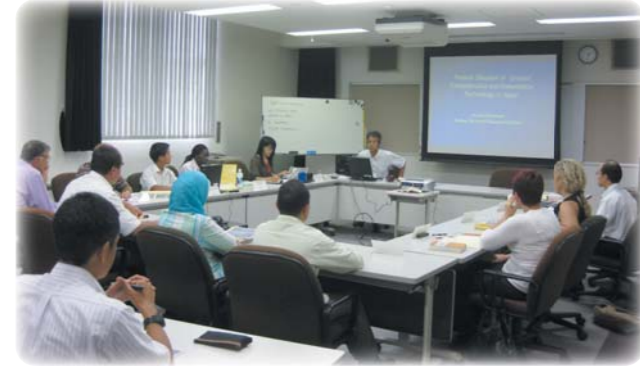
土壤污染对策培训