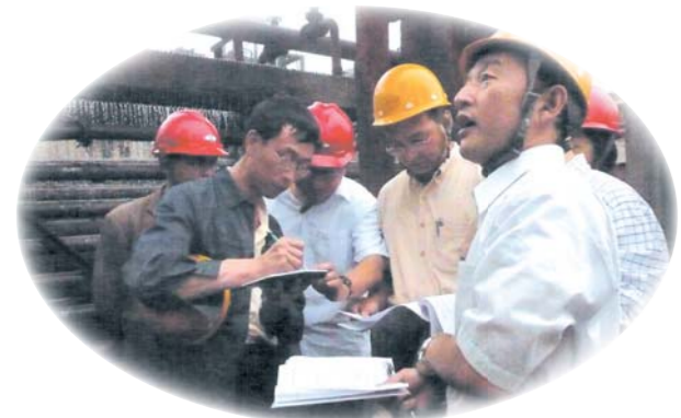
中国化学肥料厂技术指导