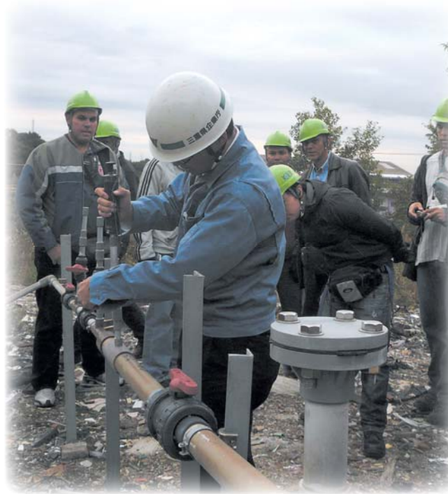
气体检测作业见习

目前，正在通过在国内接收国外培训人员及向国外派遣讲师和专家两种培训形式，开展人才培养业务。