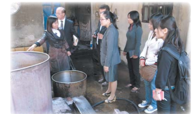
丝绸工厂的水污染调查

为了提高技术转让的成效，开展以把握各个国家环保实态为目的的综合调查，掌握问题所在，制定和建议解决对策，并根据需要提供信息和顾问。