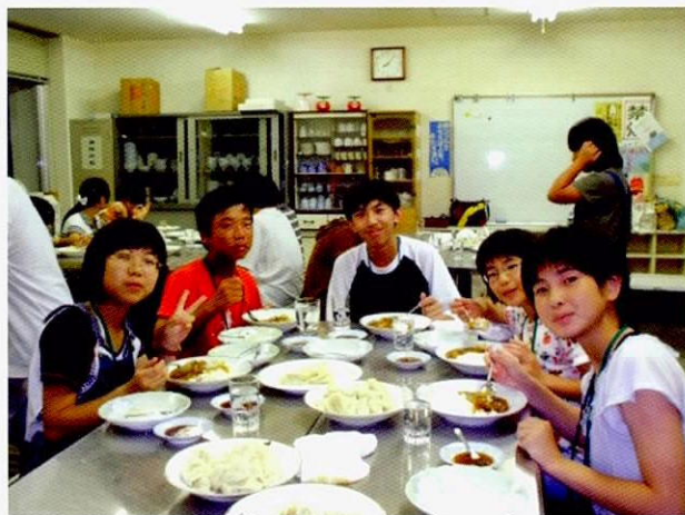
炊事交流 快乐体验烹调咖哩饭与水饺

从问卷调查等得出的结果来看，参加者对于本事业活动整体的满意程度、对于环境保护的重要性、环境改善工作的必要性的认识，事实证实了他们都有了一定的理解。他们的感想文中有许多内容都让人感受到通过同一代学生之间的交流体验，可以超越文化和习惯的差异，而成为朋友继续交往。交流是本事业的另一个宗旨，这部分