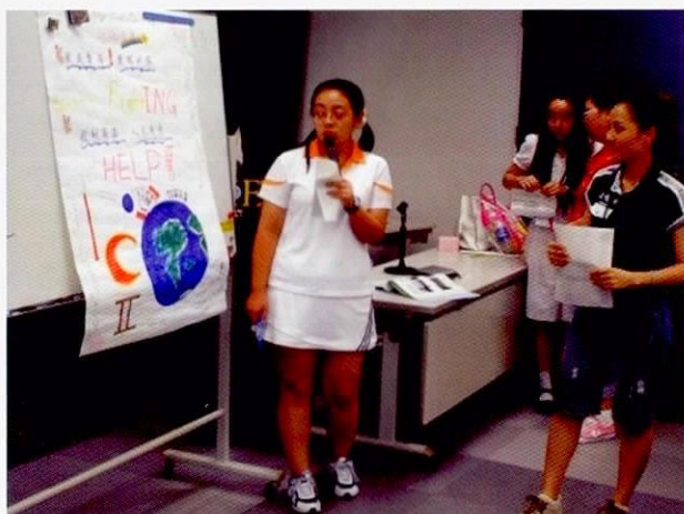
意见交换会上发表意见的情景

除此之外，还举办了中日两国的代表性料理咖哩饭与水饺的炊事教室，体验了日本的烟火、刨冰，还开办了简单的日语与中文会话教室，走访了古都——京都，通过这些活动加深了学生之间的交流。