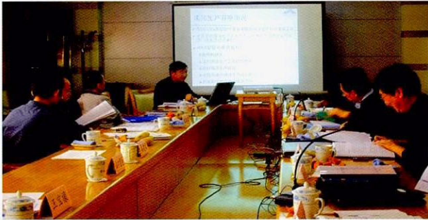
甘肃省的首次CP报告书审查会议

通过2年的活动，IPEC事业取得了很大的成果。而在这段期间，中国面向节能和削减环境污染物质的意识也日益高涨，因此要求省政府和企业比以往更迅速有效地开展CP活动。在这样的背景下，接受了甘肃省方面的强烈要求，对IPEC事业到目前为止的活动以作为追踪而实施了（1）高层人员培训班；（2）研讨会的两项活动。