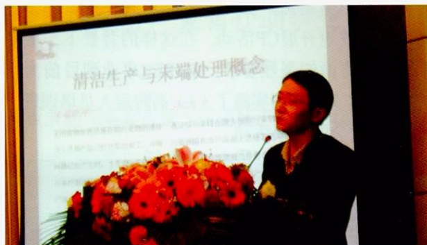
甘肃省的CP专家在“有关甘肃省CP的研讨会”上解说CP带来的好处

同时也了解了CP带来的好处以及省内企业的CP事例，还有日本的CP活动。研讨会上，在IPEC事业所培育的CP专家也根据培训后的活动经验作了发表，呼吁参加者积极导入CP。