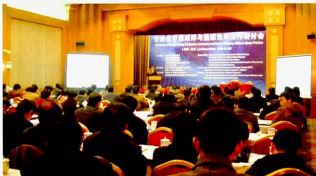
“甘肃省节能与减排和提高能源效率的研讨会”的情景

“有关甘肃省CP的研讨会”（2008年1月11日）是继去年在甘肃省的主要工业城市嘉峪关市、酒泉市、天水市之后，在甘肃省第二大工业城市白银市召开的。这项研讨会得到了白银市人民政府和市科学技术局的支持，省内行政人员和来自企业的共约