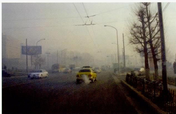
冬季时市内的大气污染

问题等不能放置不管，只是由于普及教育做得不到位，不知应该从何做起而已。他们仅仅用了一年时间就制定了蒙古最初的基本计划，并在此基础上进一步制定详细计划，开始大显身手，令人瞩目。