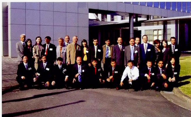
在ICETT前的合影（第1次学习旅行）

参加了学习旅行的学员们表示，在通过学习旅行中提高了自己对所在省所面临的问题以及环境改善的必要性的意识。还有些学员们也表示，在讲座上所学的内容、信息，通过实际见识日本政府、企业的工作活动，而能够有了更深一层的理解。也有学员表示，学习旅行是对于行政方面今后在引进技术、实施改善的工作上能够开展些什么样的活动的一项考察。