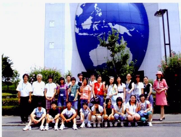
在中部电力公司川越电力馆

财团法人国际环境技术转让研究中心把围绕环境问题的交流、普及和启发作为其重要活动之一，从1996年起以小学高年级儿童和初中生为对象举办“暑假亲子环境交流教室”，该教室活动结合环境方面的实习、讲座、参观，还安排与海外培训人员开展交流。从2002年起接受四日市市的委托，开始实施“儿童地球环境私塾班”，为扩大原有“教室”活动实施的形式，而以众多的儿童（小学生）为对象，努力谋求立足于国际领域的环境问题的普及和启发。