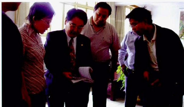
有关在QC培训现场实习中分析问题的实践

QC培训（2007年9月3日～7日）在稻垣系统咨询事务所的稻垣所长的帮助下得以实施，目的是为了从事企业CP活动人员的解决问题和设计改善方案的能力。学员通过讲座和现场实习了解了QC的观点和一整套的手法工具，明白了提高产品质量还包括削减生产活动中的能源消耗和环境污染物质。在演习和现场实习的过程中利用QC的一整套手法工具分析了问题，认识到工具的有用性。同时也讨论到QC的观点和一整套的手法工具在CP活动和CP监查上的应用，认识到这一新获得的观点和工具在既