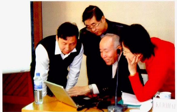
节能培训中接受技术指导的学员

另一个节能培训（2007年11月12日～16日）的举办目的是为了促进工厂第一线有效的节能对策。培训中，由中国清华大学的孟昭利教授就中国的能源政策和能源监查作了讲解，以及日本栗原环境技术研究所的栗原茂所长就工厂节能方面的技术性知识和管理方法作了讲解。学员们对于自己被要求提出怎样的节能对策提高了认识，对于工厂内的节能可能性、节能所需的必要数据和分析事项、节能技术、为使节能效果得以持续和提高所需的管理方法等加深了理解。IPEC事业更于2008年1月再次邀请栗原专家赴兰州指导，在参加了本培训的腾达西北铁合金有限责任公司和兰州新西部维尼纶有限公司进行了现场实习，提高了学员的节能对策能力。