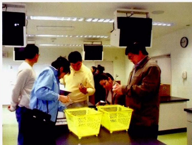
通过购物游戏体验学习

在蒙古的学员中也有一位歌手，带头演唱了歌曲。还有在日本也颇有名气的歌手欧芸娜一家正巧也来了日本，参加了这个聚会。当天的参加者非常有幸听到了两位歌手的歌声。