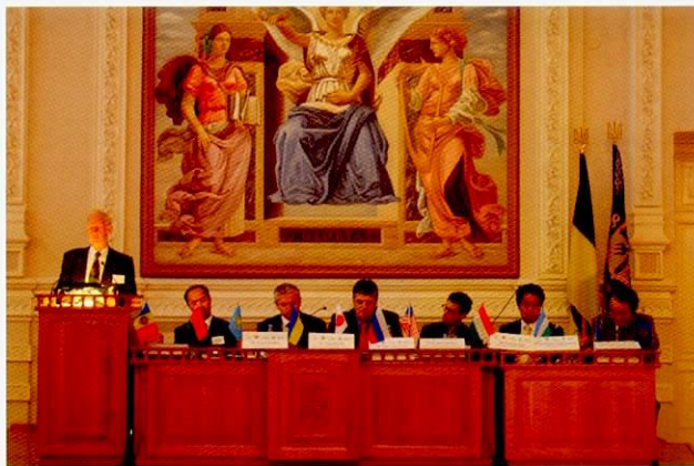
研讨会先由驻乌克兰特命全权大使马渊睦夫

参加本研讨会的有：欧洲各国、美国、日本以及独立国家联合体（CIS）的各国代表，内外产业界代表，联合国气候变化框架公约（UNFCCC）、联合国工业发展组织（UNIDO）、有关可再生能源及能源效率伙伴关系计划（REEEP）等国际机构代表，欧洲复兴开发银行（EBRD）、国际协力银行（JBIC）等金融机关代表，以及基辅工科大学等，聚集了产业、政府、学术、金融各界人士的参加。