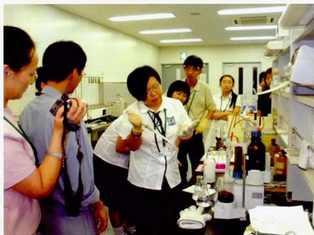
在四日市港区管理工会进行COD测定实验

学习内容包括有以地球温暖化问题为中心的地球环境问题一般的讲解；通过对二氧化氮、悬浮粒子状物质的观察和实验，学习大气的状况；讲解地球的能源状况和参观发电厂；以垃圾分类为题材学习资源的有效利用；水环境保护的讲解并参观实验设施；参观有益于环境的能源生产设施；有关在农业生产领域的环境与安全的配合；参观将环境视为经营理念之一的联合企业；学习四日市克服公害的历史；观察四日市市内的自然环境等。通过这些涉及多方面的环境学习，及根