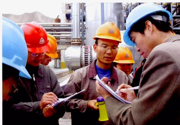
培训师进修培训时的现场实习