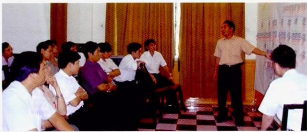
在小组演习时作发表的学员

解在新的环境保护法和国家政策下地方政府所应承担的责任和作用。培训除了讲座以外，还应用项目循环管理（PCM）的手法，学员们自己共同分析了各省的现状与问题等，制定了行动计划。