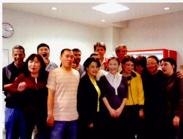
与欧芸娜在一起的各国学员

最后，借此机会向本项培训中接受参观和讲课的各位相关人士表示感谢。培训富有意义，学员们传达了他们的谢意，感谢你们的帮助！