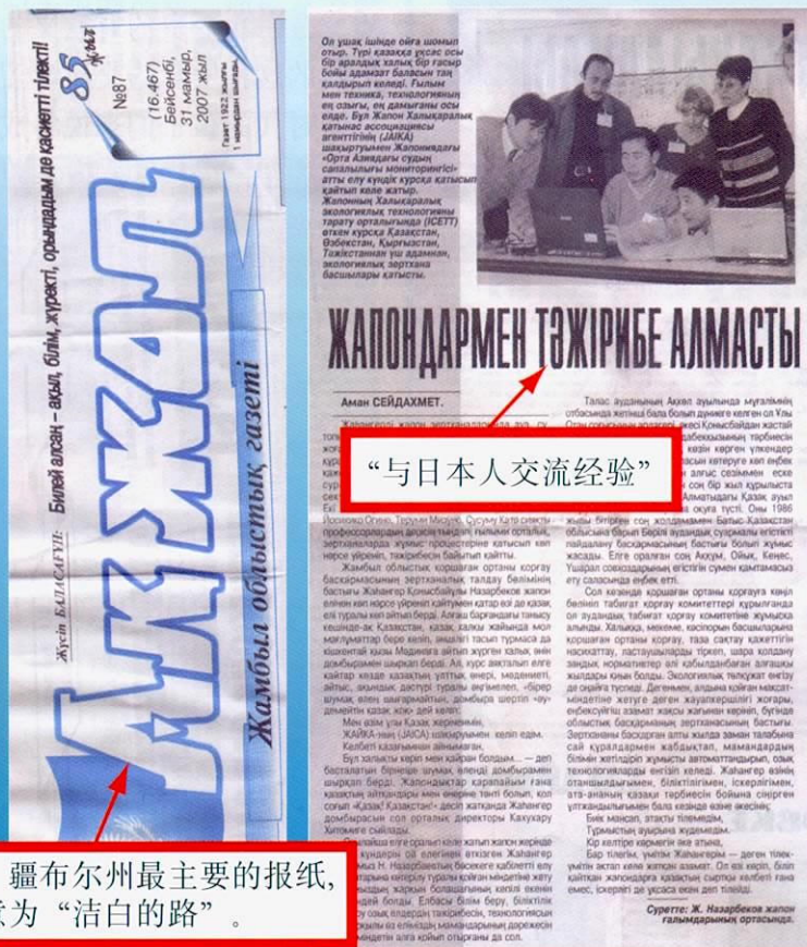
阿克乔报：疆布尔州最主要的报纸，报纸名称意为“洁白的路”。

他还谈到为了达成学习先进国家的专业信息、经验、技术的目的，在加深双方的理解是有必要的。最后谈到他的愿望是哈萨克斯坦人不仅在外貌上与日本人相似，而在勤劳方面也能与日本人接近。看到这则投稿的报导后令人深切地感觉到进一步加强国际合作的重要性。