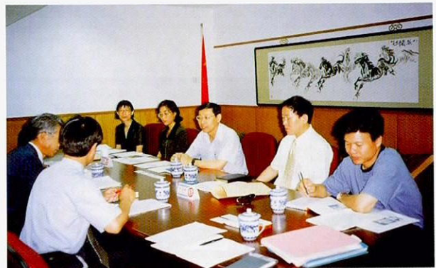
北京派遣人员的商讨场景

特别是近年来,由于北京市的汽车排气的原由,造成了大气污染的情况相当严重,所以将汽车排气的问题作为重点进行了实施。另外,实行委员会主要由北京市计划委员会负责进行,国家发展计划委员会的GAP事业负责人也预定将参加这次的活动。