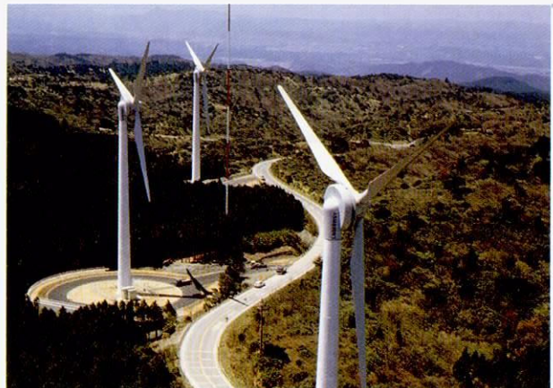
久居市风力发电设施

设施引进后, 市民们的反映除了供电等的好处外, 缓慢旋转的轮叶增添了风景之美, 同时还是市民们或参观者在此休息的象征地。久居市也因此而闻名全国, 吸引了不少来自全国各地的客人。该设施所带来的各种效果, 类似这种情况对进修生来说, 也可以作为引进设备的一个重要参考。