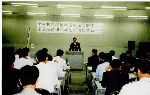
1998年度 与地球环境保护有关的所有产业技术开发促进事业 研究会场景（1999年7月6日）