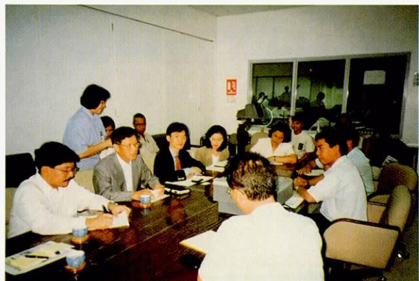
在伊姆斯市与企业的会谈

伊姆斯市在进行办理条例、计划批准手续的同时，正在将实施政策中的一部分条例进行实验，其中特别引人注目的是，将一般废弃物的堆肥化处理设施设置在试行的实验地区的市区内，将各家庭取出的生食垃圾进行堆肥化处理，试用于可否作为家庭菜园等的肥料。虽说这只是一个小小的尝试，但是，从中确体现了行政和居民的相互协助，依靠当地力量，努力减少环境污染物质(食物垃圾)，也可以说是伊姆斯市在综合性环境保护工作上的具体表现。