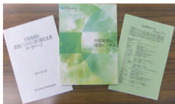
数据库、技术种子汇集手册

http://www.chubu.meti.go.jp/kankyo/kankyo_business_english.htm#database