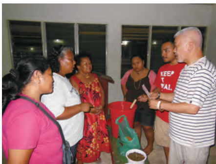
在集会处（BAI）进行演示

根据对参与居民监测的结果，确认了人们对居住环境和废弃物提高了意识，如开始关注自家以外公共空间的垃圾等等。大量参加申请从该州的其他地区蜂拥而至，州政府计划今后5年内主要在主要地区阶段性地推行该系统。（大矢）