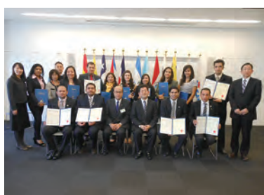
中南美研修 结业式

作为研修小结，研修员梳理了本国应完善的课题等事项，根据研修中收获的知识及运用技术的方法等，就改善收集渠道、加强启发工作等回国后要实施的内容，编制了行动计划方案，并进行发言。