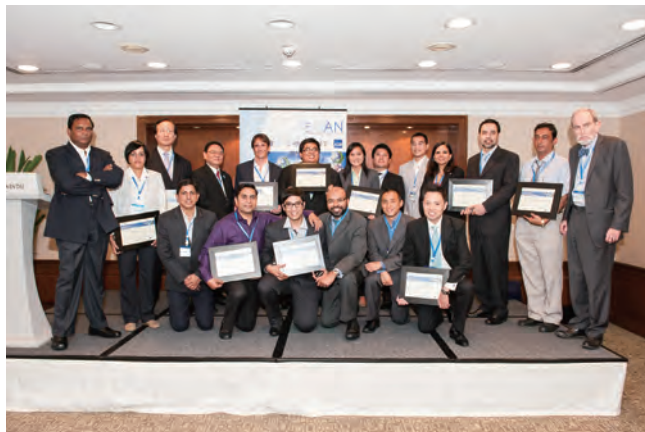
优秀项目事业开发者

经济产业省宫地慧在主题演讲中指出，“作为国际社会的一员，日本政府通过经济产业省，一直在支援CTI的活动，例如由ICETT（日本国