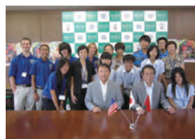
四日市市长和市议会议长

今年7月24日是1972年四日市公害诉讼判决40周年的日子，此次便以“四日市公害与环境改善”为主题，学习四日市发生的公害以及环境改善的举措。