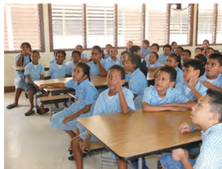
在小学开展的推广活动加入了环境教育