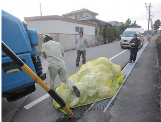
Time & Motion 情景