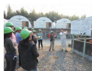
中南美研修 参观四日市内填埋处理场

研修员通过本次研修和研修员之间的交流，把握了本国和本地区废弃物管理所处的阶段，并通过日本的案例，针对今后需要完善的问题主动提问、开展讨论，努力学习，这样的姿态让负责研修的人员也非常期待研修员在研修中学会的知识能不断推广。