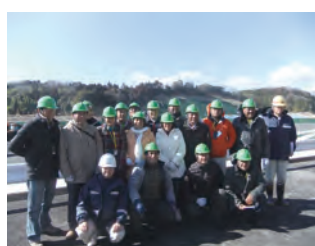
秘鲁研修 参观新小山处理场