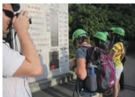
参观四日市市内设施

研修课程中，听取了市民、企业和政府等多方人士讲课，内容涉及完善为克服四日市公害而建立起来的三重县四日市市独有的公害患者救济制度、硫氧化物总量管制等国内领先的环境政策，以及在四日市公害改善过程中收获的经验与教训，还参观了环保设施。这一周时间，学生们通过在ICETT的集体生活，重新审视各自的国家，从而重新立足于国际化视野，加深了对环境问题的考量。接触日本的传统与文化后，也愈发提高了对日本的兴趣和关注。