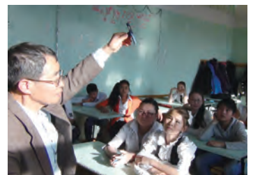
为环保俱乐部授课 (简易大气测量)

讨会聚集了学校老师及教育相关机构和市民团体等54位居民，会上，除了四日市公害的历史、大气分布情况分析报告以外，还作了环保俱乐部和市民团体工作报告，提出建立《大气环境改善计划》。